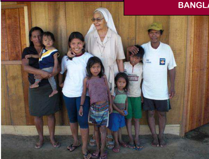
PROGRAMA AYUDA A NIÑOS (PERÚ)