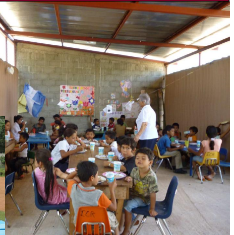
COMEDOR GRANADA (NICARAGUA)