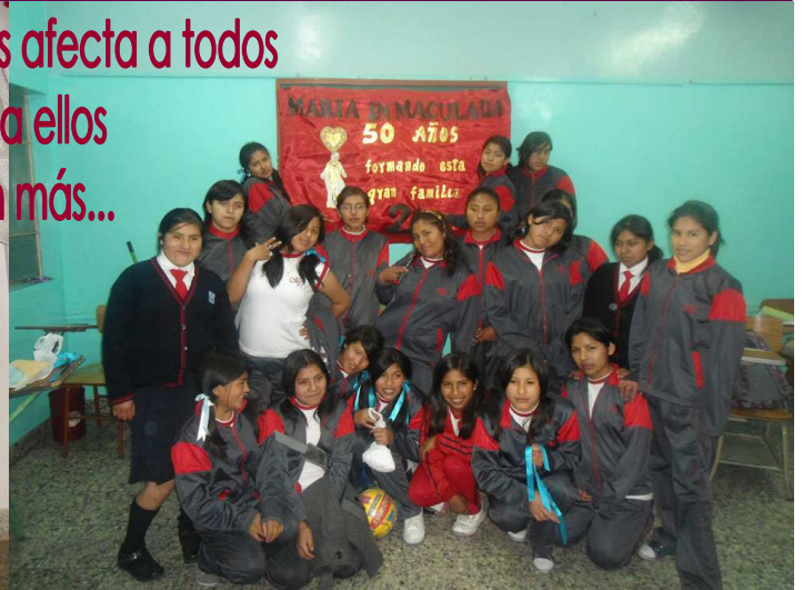
NIÑAS APADRINADAS EN AREQUIPA (PERÚ)