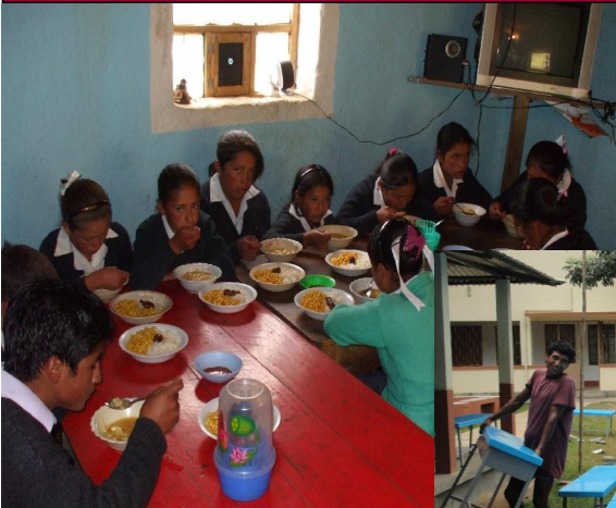
COMEDOR-GUARDERÍA EL TESORO (GUATEMALA)