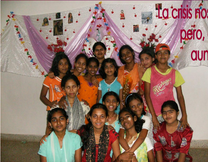
NIÑAS APADRINADAS EN MANGALORE (INDIA)