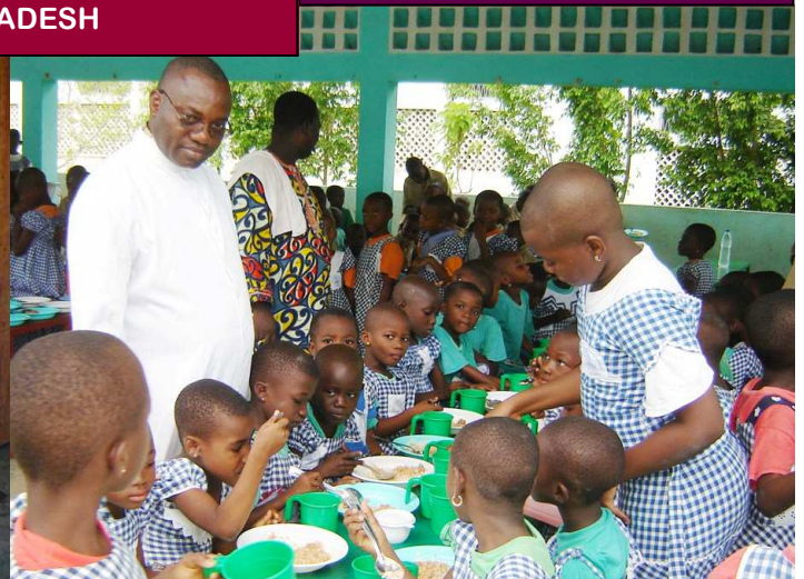
COMEDOR NIÑOS HUERFANOS (COSTA DE MARFIL)