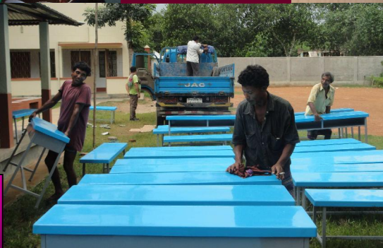
MOBILIARIO ORFANATO BANGLADESH